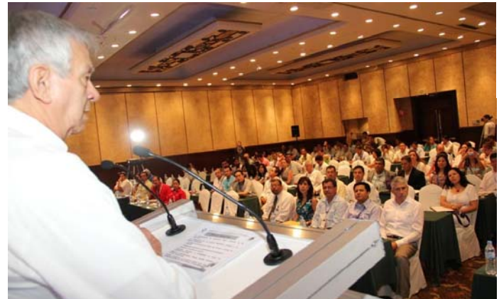
Sistema de Rendición de Cuentas

Por otro lado, informó que la Secretaría de la Función Pública a través de la Comisión Intersecretarial para la Transparencia y el Combate a la Corrupción, impulsa y coordina acciones y estrategias que permiten reducir riesgo de corrupción y buscan mejorar la transparencia de la información y de la gestión pública.