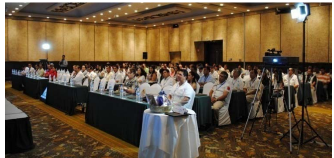
Foto oficial de inauguración